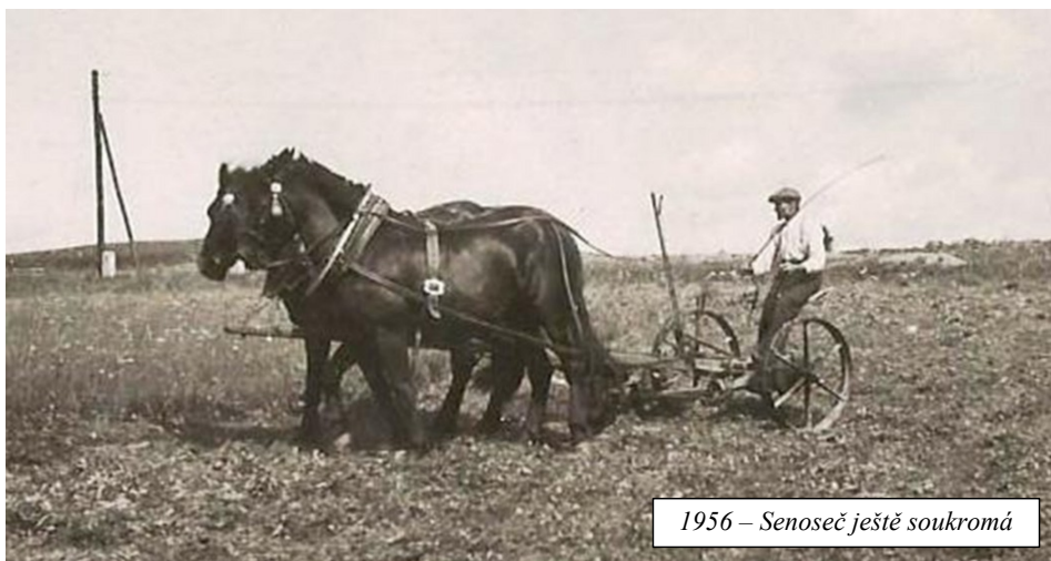
1956 – Senoseč ještě soukromá