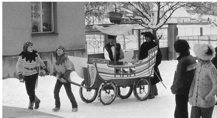
Občerstvení „Santa Jára“

Jednalo se celkem o 60 osob starších osmnácti let. Byla postavena pojízdná radnice s krčmou, v dobových krojích účinkovali rychtář, písař, drábové, krčmář i pojízdná