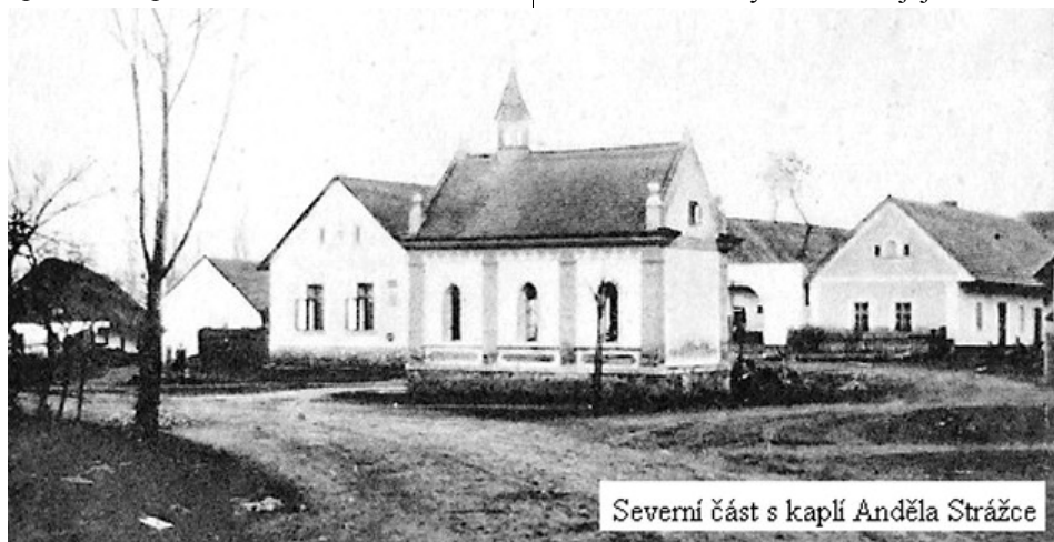
Severní část s kaplí Anděla Strážce