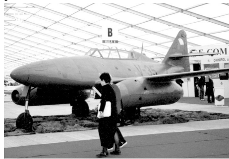
Proudový letoun CS-92 (Me-262)

Po válce zůstává A.Kraus v Avii a zastává funkci šéfpilota a zalétává celou řadu letadel, opravovaných, či vyvíjených pro naši armádu. Tak se dostává i k létání