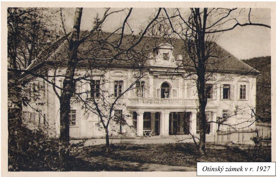
Otínský zámek v r. 1927