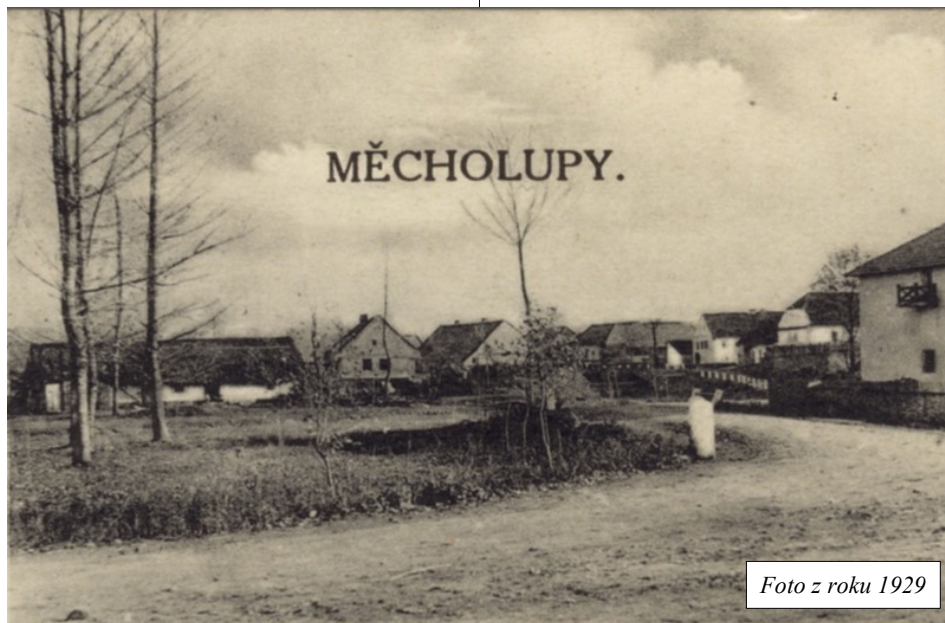
Foto z roku 1929

Každý člověk jednou odchází tam, odkud není návratu a jen práce, kterou vykonal, přetrvává a brání nám zapomínat. Co po něm zůstane? Fotografie v nějaké krabici nebo zásuvce, úřední doklady, které se časem vyhodí, kartotéční lístek na nějakém úřadě. A také vzpomínky lidí, kteří ho měli rádi nebo se s ním setkali. Těch bude stále méně a budou čím dál neurčitější. A tak se ohlas lidského života vytrácí až zmizí úplně.