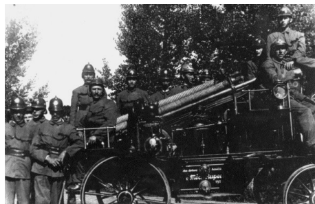
SDH Měcholupy s první stříkačkou

cích sbor dostal 21 000 Kč, obec zaplatila 20 560 Kč a sbor z vlastní pokladny 28 618 Kč.